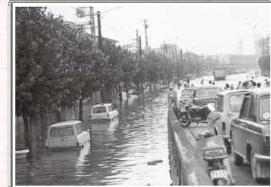
国道2号線大物陸橋西詰付近(昭和42年ごろの様子)

尼崎市は、市域面積の約30%が海面よりも低くなっており、降雨があっても自然に海や川へ排水することができません。市域に降った雨は下水道管を通してポンプ場や処理場に運ばれ、ポンプの力で海や川へ放流されます。都市化が進むにつれて地面が舗装され、雨水の大半が下水道管に流れるようになったため、下水道の役割は重要なものになってきています。