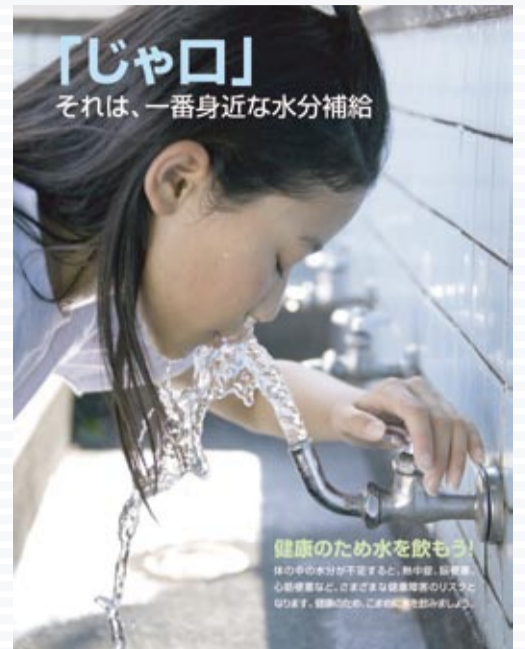
主催：健康のため水を飲もう推進委員会 後援：厚生労働省