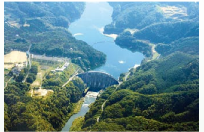
高山ダム(昭和44年完成・京都府相楽郡)

尼崎市の水道は誕生してから今年で91年になりますが、コツコツとこの水源開発に参加し、必要な水利権を手に入れました。