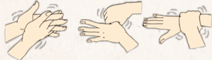
指の間を洗います。