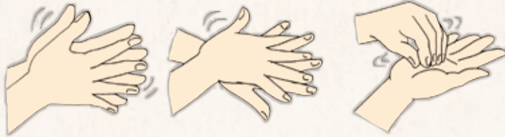
流水でよく手をぬらした後、石けんをつけ、手のひらをよくこすります。

日頃から爪を短く切るなど清潔を心がけ、手を洗うときは腕時計や指輪をはずして、洗い残しのないようにしましょう。洗った手を拭くタオルを共用にするのはやめましょう。自分専用のもので、ペーパータオルなどを用意しておくのもおすすめです。