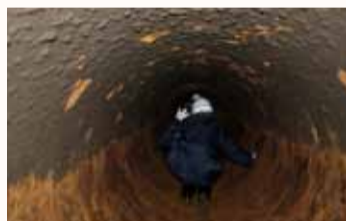
※広報用の企画であり、実際には工事現場の見学はできません。

散歩気分で出かけたけれど、水道管の中を歩くのはとても大変でした。工事のたびに中に入らないといけない職員の方の苦労が理解できました。これからも取り替え工事は続いていくそうです。頑張ってくださいね!でも、見学は外からだけにさせてください(汗)。