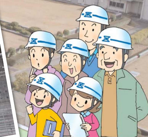
(広報上の企画です。実際は工事を見学することはできません。)

配水池とは、浄水処理した水道水を一時的に貯めておく貯水タンクのことです。地震などの災害時には応急給水拠点として活用されます。