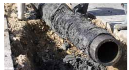
当時使用されていた木管

尼崎市に水道をつくらうとしたときは、第一次世界大戦中で水道管の材料となる鉄などがとても高く、やむを得ず市議会で木管の使用が可決されました。今でも当時使用された木管が時々出土しています。