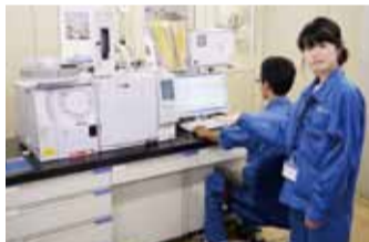
厳しくチェックしています。

カビ臭を検査する機器は少しの汚れでも誤差が発生するため、メンテナンス作業などを厳しくチェックしながら確実にを行います。