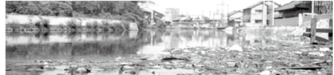
地盤沈下のため流れが止まり、ごみためめになった大物川(昭和40年)

現在では、ほとんどの生活排水を公共下水道で処理し、残りも浄化槽やし尿の汲み取りで処理することで、生活排水をほぼ100%処理しているんだって。