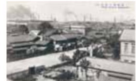
尼崎工場地帯(昭和4~6年頃) 絵はがき

昭和の初期から戦後にかけて、尼崎市の工業はめざましい発展をとげたんだよ。地下水を汲み上げて使う工場が多かったことから、地盤沈下を防ぎ、工業用水の安定的な供給を目的に工業用水事業が始まったんだよ。