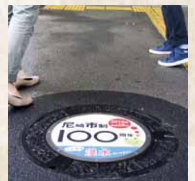
デザインマンホール