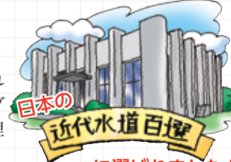
近代水道百選に選ばれました!

カビ臭物質の発生について長期化・多発化することが予想されたことから、カビ臭物質への対策として、メーカーの協力を得てオゾンで臭いを取る実験を開始し、昭和48年に日本で初めてオゾン処理施設が完成しました。