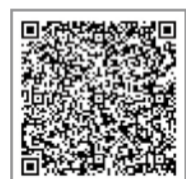
▲検索はこちらから

家庭の排水器具には、臭気や害虫などの侵入を防ぐため、管の内部に水を溜めるトラップが設置されています。室内で臭気がするとき、トラップに不具合が生じている可能性があります。一度、下水道排水設備指定工事店にご相談ください。