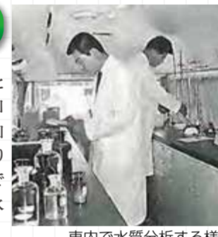
車内で水質分析の様子

水源を淀川に移してから浄水処理の問題となるような水質汚染はありませんでしたが、昭和30年頃から淀川流域の工業の発展と人口増加に伴って汚染が急速に進みました。それにより水質異常による事故が増加したため、尼崎市では水質試験車を導入してまちなかでも車内で水質分析できるような取り組みも行いました。